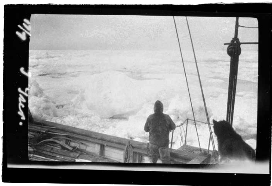
Амундсен на палубе «Мод». 17 июля 1920 г.