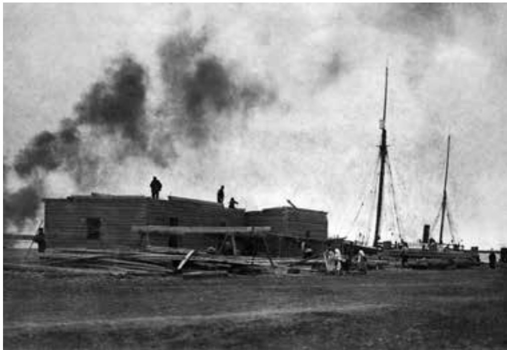
Постройка экспедиционных зданий в Соломбале

Тобольские собаки числом тридцать штук давно прибыли и размещены в особом загороженном месте на дворе. По временам они поднимают такой лай и вой, что бывает жутко. Собаки особенно беспокоятся ночью и задают порой такой концерт, что при всем желании уснуть не представляется возможным. Днем и по вечерам мы кормим их хлебом, а также пригоняем упряжь и даже пробуем запрягать в нарты. Ожидаем еще прибытия пятидесяти собак архангельских.