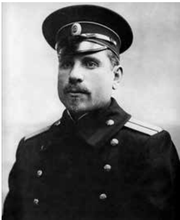
Г. Я. Седов