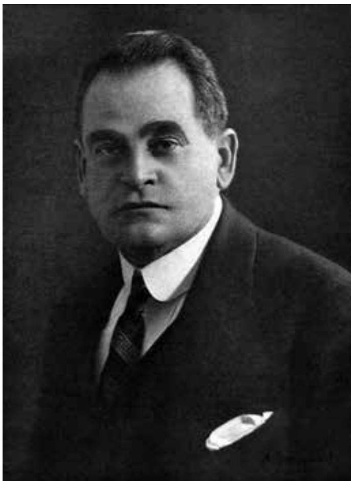
Павел Григорьевич Кушаков (1881–1946)