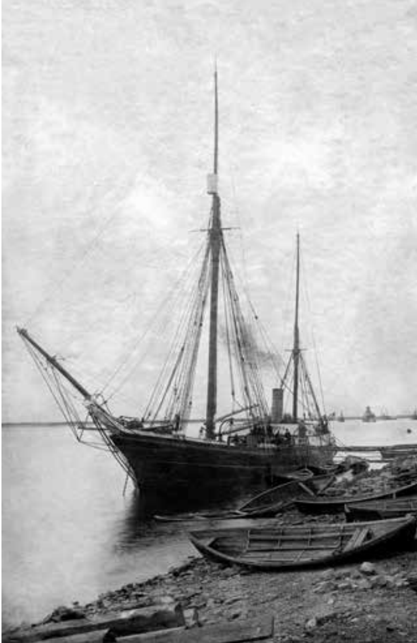
«Святой Фока» у пристани в Соломбале