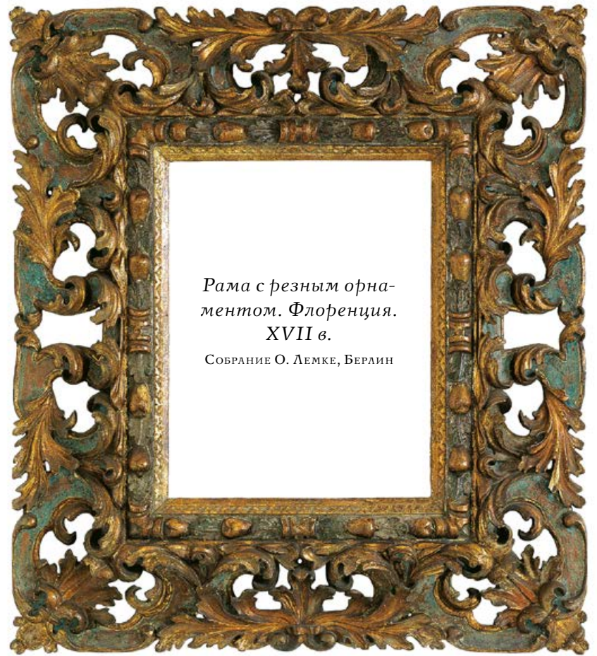
Рама с резным орнаментом. Флоренция. XVII в.