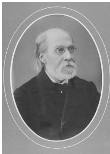
Николай Петрович Вагнер (1829–1907).

Пока другие участники экспедиции обследовали Мурманский берег Баренцева и все берега Белого моря, Вагнер «взял на себя частную, но более обещающую задачу — обследовать один угол этого моря, довольно обширную бухту, богатую маленькими островками, — бухту Соловецкого монастыря» (Вагнер, 1877). Это место покорило его совершенно. Оставленное Вагнером описание предельно точно формулирует причины создания биостанции, но при этом по поэтичности не уступает его сказкам. «Наверное, ни одна местность не способна окружить исследователя таким тихим, уютным покоем, таким отчуждением от интересов дня, интересов насущной жизни, как бухта Соловецкого монастыря, которому я поистине обязан полными удобствами для моих исследований. Эта невозмутимая тишина среди пустынных, безлюдных мест, эта полная свобода, данная исследователю располагать вполне своим временем и делом, должны, по-моему, привлечь каждого, желающего без помехи работать над жизнью морских животных. Но в то же время это отчуждение от цивилизованной жизни крайне затруднительно для исследователя, лишенного книг, инструментов, приборов, посуды и пр. Чтобы воспользоваться удобствами местности и уничтожить эти неудобства, мне пришла мысль учредить на берегу Соловецкого острова зоологическую станцию» (Вагнер, 1877).