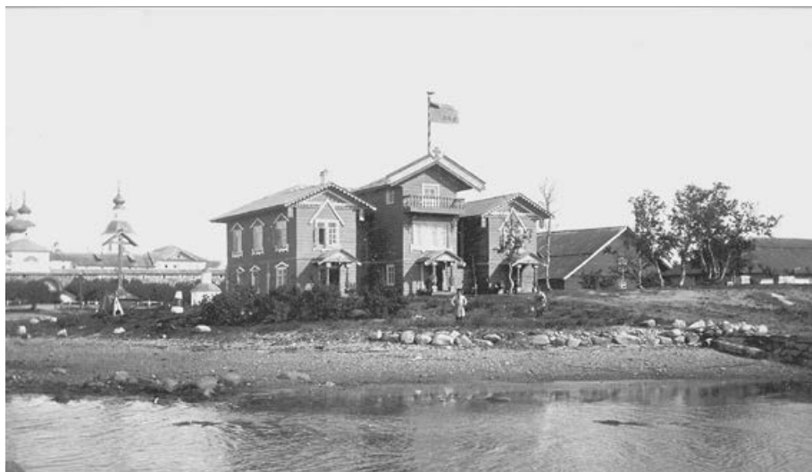
Общий вид Соловецкой биологической станции. 1897 г.

(Фокин и др., 2006)