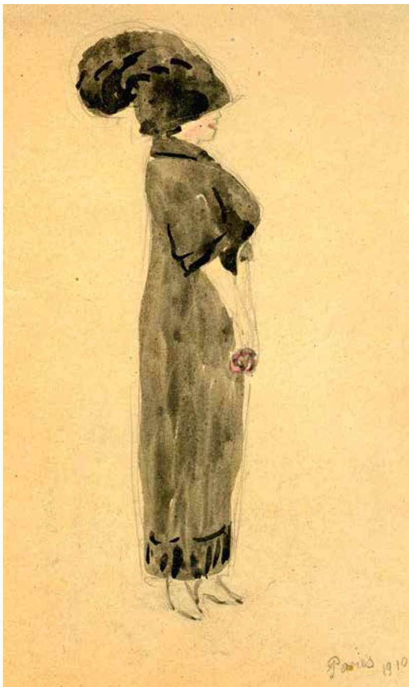
Н.М. Чернышев. Из парижских зарисовок. 1910. Бумага, граф. карандаш, акварель. Собственность семьи Чернышевых. Москва. Публикуется впервые