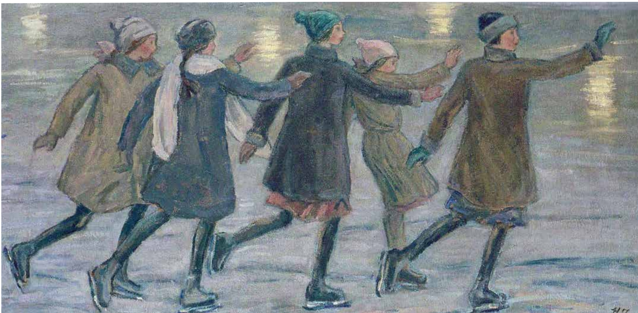
Н.М. Чернышев. На каток. 1928–1958. Холст, масло. 54 × 106. Саратовский государственный художественный музей им. А.Н. Радищева

Эйфелевой башни. Оборачиваясь вправо, на восток, я вижу башню обсерватории Сорбонны, и душа моя уносится из Европы, далеко, к рубежу Азии.