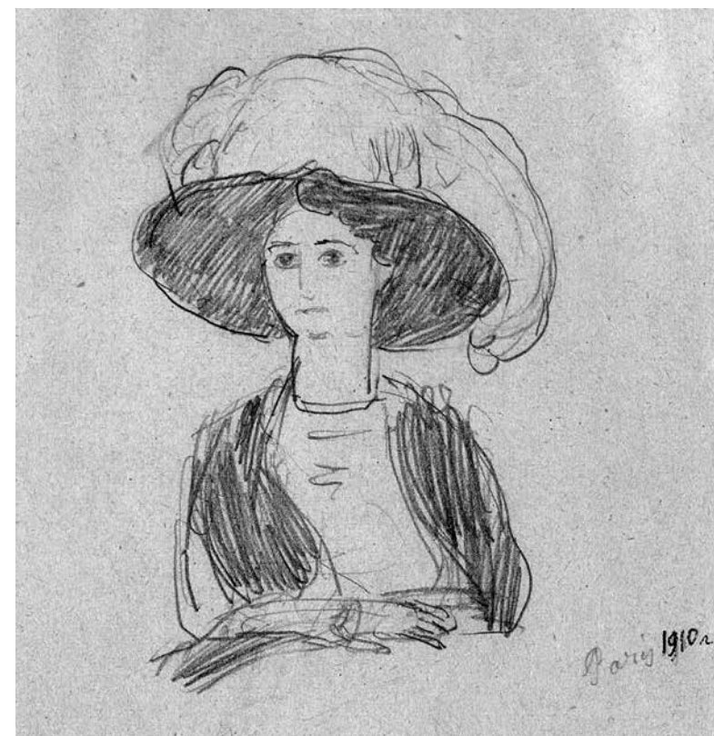
Н.М. Чернышев. Из парижских зарисовок. 1910. Бумага, граф. карандаш. Собственность семьи Чернышевых. Москва. Публикуется впервые

И в русском ресторане отдыхали от утомления дня. Там оставалось мало публики... Мы отдыхали под звуки бродячих скрипачей, и эта случайная музыка роднила нас с чуждым городом.