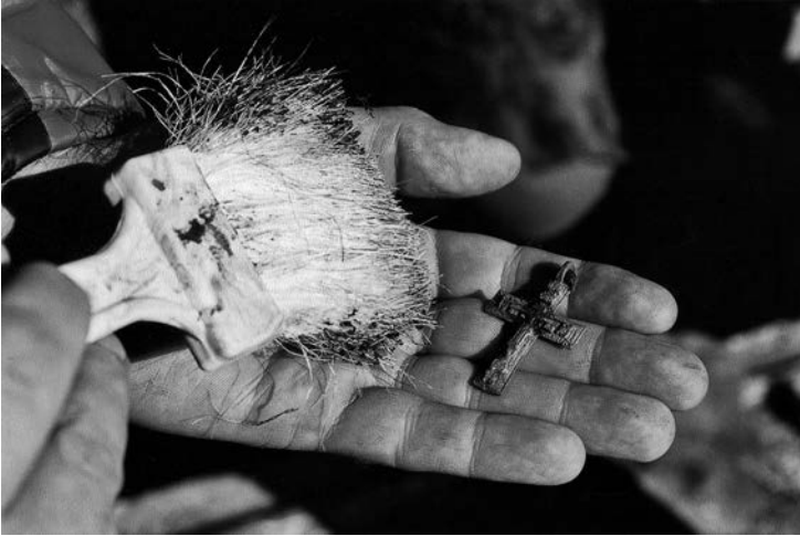
Крест, который носила Т. Прончищева. (Экспонат Калужского краеведческого музея.)