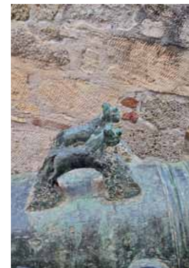
Русская пушка с клеймом Олонецкого литейного завода с линейного корабля «Святой Евстафий Плакида»

(по другим данным, табакерка с драгоценными камнями) графа Алексея Орлова, подаренный ему Екатериной Великой, все еще лежит на дне. Граф обронил его случайно от расстройства чувств, решив, что на «Евстафии» погиб его брат Федор Орлов. В центре внимания посетителей музея – русские пушка и бронзовый единорог. Любой историк может без труда узнать в них продукцию Олонецкого литейного завода. По словам местного смотрителя, туристы приезжают именно ради них. Они – главные экспонаты музея. Вход в единственный зал украшает картонная Екатерина в натуральную величину. Ее изображение недвусмысленно указывает, что экспозиция посвящена Чесменскому сражению и участию в нем русских, Екатерине и ее политике и планам.