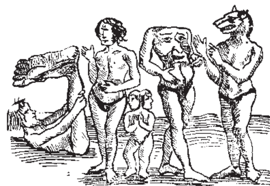
2. Фантастические песеглавы и другие чудовища, якобы населявшие север Восточной Азии.

(Из «Космографии» Себ. Мюнстера, 1544 год).