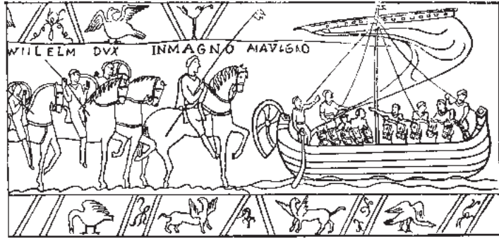
4. Отплытие викингов. (По рисунку на древнем гобелене в Байе. XI век).

тельную колонию, которая в темные времена средневековья стала оазисом культуры и дала школу историков, какой в эту эпоху не было ни в одной европейской стране. Нередко викинги пробирались и в Белое море, где конечной целью путешествия являлось устье Северной Двины. В X—XI веках викинги находили здесь богатейшие селения. Наперекор суровой северной природе жители Беломорья осваивали свой край, добывали зверя, строили не только поселения, но и богатые, красивые храмы.