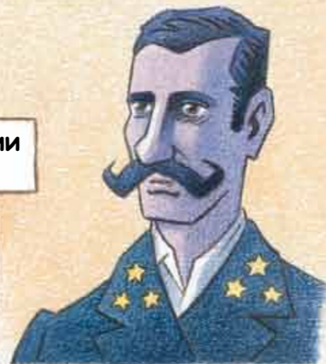
Адриен де Жерлаш

Именно они летом вызволяют корабль из ледового плена, прорубая во льду каналы, и выходят в открытое море.